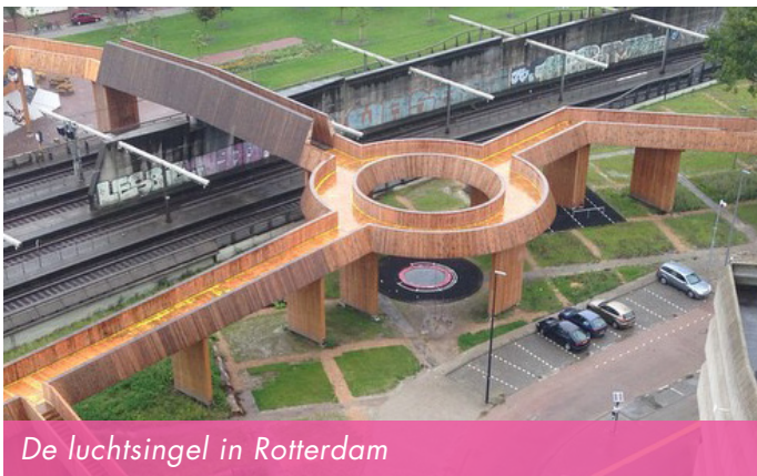
De luchtsingel in Rotterdam

Een bekend Nederlands civic crowdfunding project is de Luchtsingel in Rotterdam. De gemeente zet drie jaar lang een grote pot geld op tafel